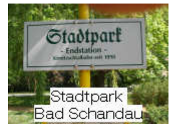
Stadtpark Bad Schandau