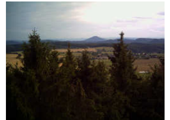
Hintere Sächs. Schweiz