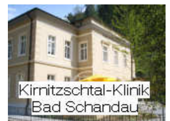
Kirnitzschtal-Klinik Bad Schandau