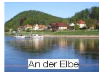
An der Elbe