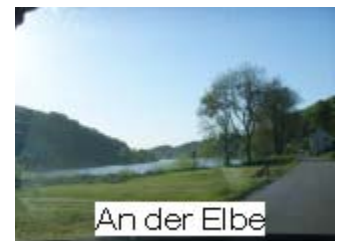
An der Elbe