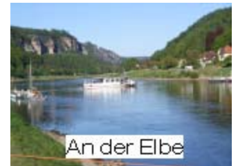
An der Elbe