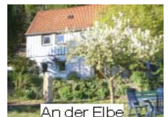
An der Elbe