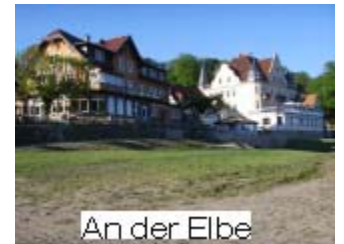
An der Elbe

Wenn das Museum geschlossen hat, fällt die Entscheidung zum Weiterfahren nicht schwer und wir lassen den Parkplatz links liegen und folgen dem Waldweg bergan.